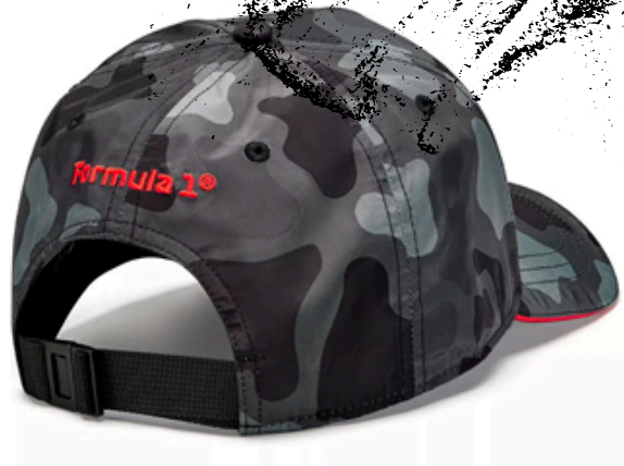
Oracle Red Bull Racing Miami