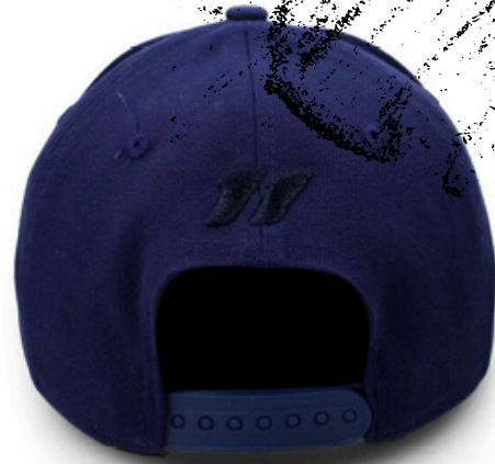
Mercedes Benz Amg Petronas