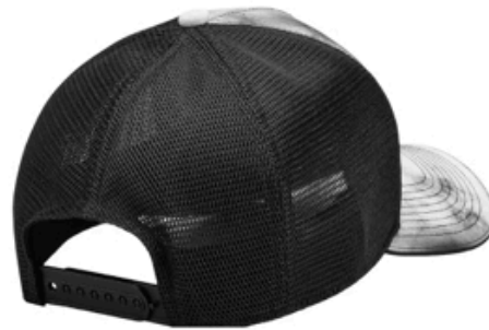
MERCEDES BENZ Gorra Equi-