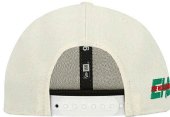
MERCEDES BENZ SCPH